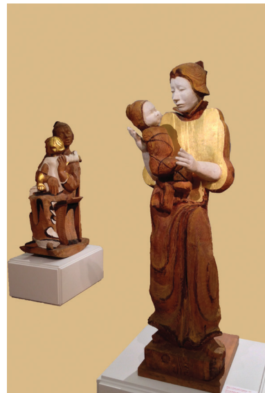
«Иди и след мой сохрани».