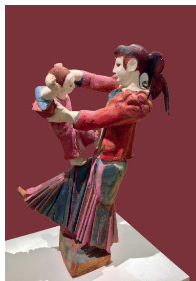
«Весна на Оке».

тей, пропущенная через себя, ощущается даже в сложных и порой грубых материалах — дереве, керамике. Но скульптор смягчает эти грубости и шероховатости материалов посредством введения ярких цветов и позолоты.