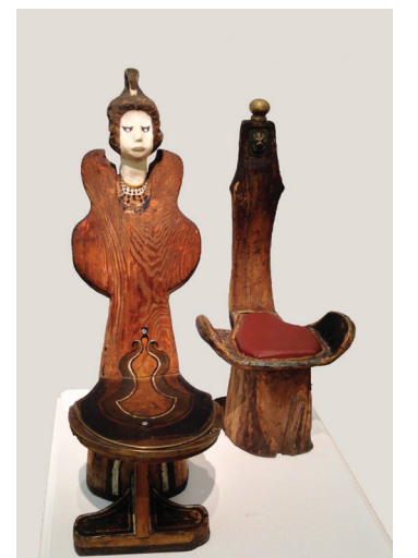
«Стул с женским портретом и стул с маской льва».