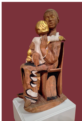
«Успейте петь колыбельные».