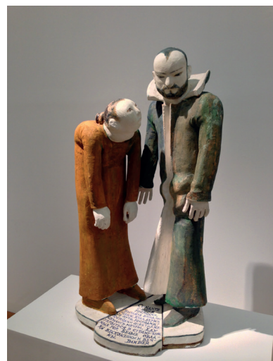
«Белые облака бесконечны и вечны».