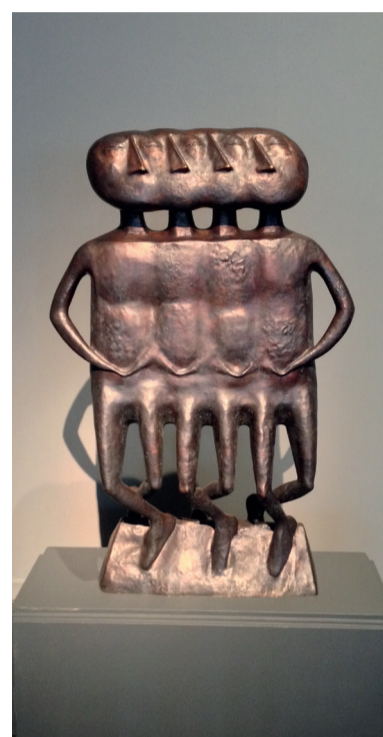
«Лебединое озеро». 1994

беря за основу традиционные сюжеты и всегда работая с одним и тем же материалом – бронзой, скульптор интерпретирует понятия, подводя их под знаменатель своего стиля и манеры исполнения. Возьмем, например, миниатюрный брусочек «Вуглускр», напоминающий Пегаса, или «Гиппопотама» и того же «Жеребенка», восходящих к привычной всем анималистической традиции.