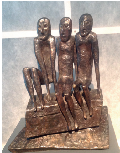
«Ночные гости». 1988