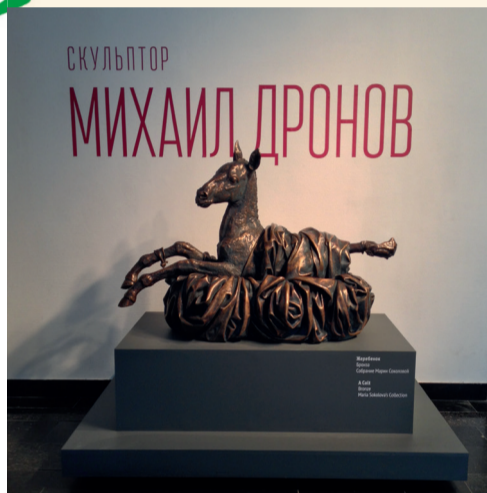
«Бронзовый век Михаила Дронова». стр. 1-2