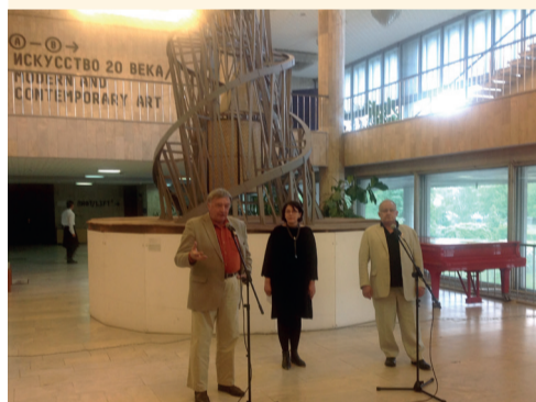
Открытие юбилейной выстав- ки М. Дронова в Третьяковской галерее