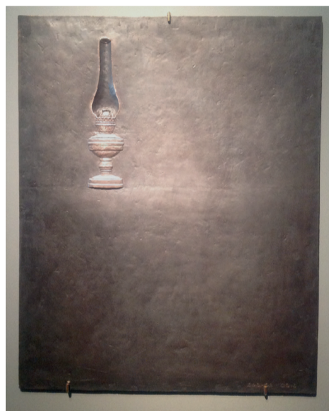
«Четыре стихии. Огонь». 2016

На обоих входах гостей встречают разные работы, что в каждом случае создает у зрителя особый настрой. В первом случае, это ранняя работа «Жеребенок». Во втором – легкое трио, как раз под стать текущему времени года – «Тень за забором», «Добрый вечер» и «Кленовый лист». Что это – столкновение классицистической скульптуры и формализма? Или демонстрация широких пластических возможностей и мастерства скульптора? Безусловно, второе. Убедиться в