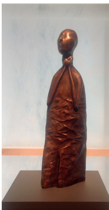
«Се ля ви». 1993