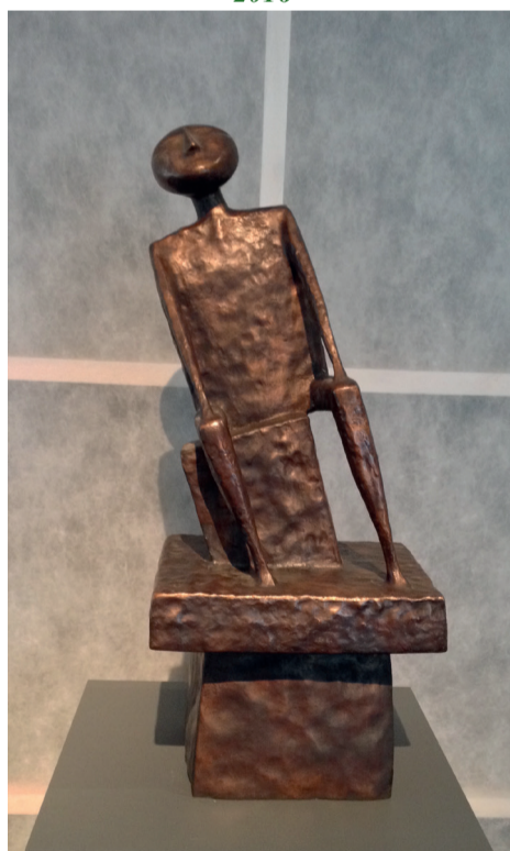
«Моя жизнь». 1994