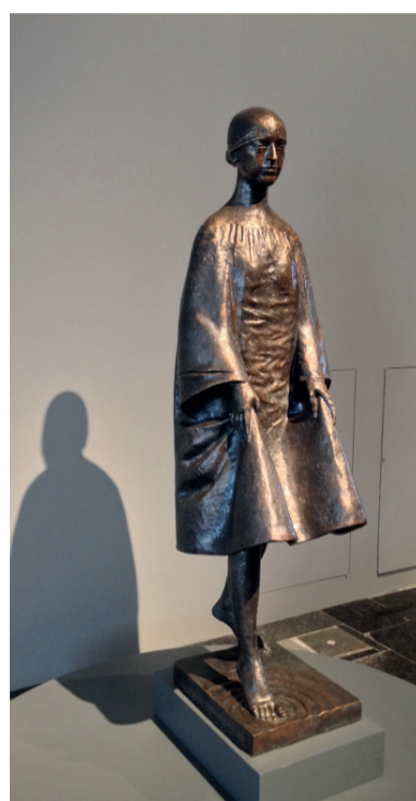
«Бегущая по волнам». 2006