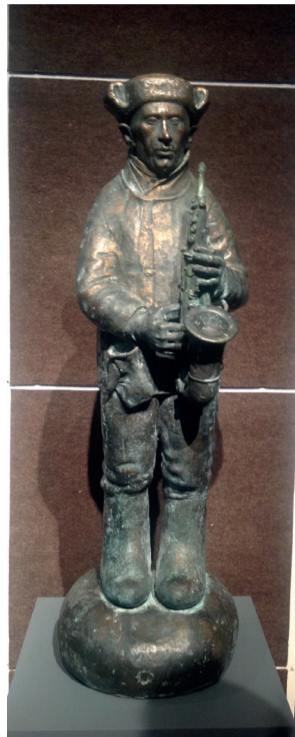
«Зимние похороны. Соната № 2». 1987

Разнообразная по всем параметрам экспозиция обогатена, в частности, рельефами, стоящими на стыке графики и живописи. Часть из них (например, «Сладкие шестидесятые» и «Утро») уже установлена на специальные